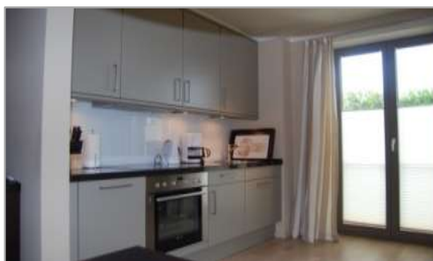
Hochmoderne voll ausgestattete Küche