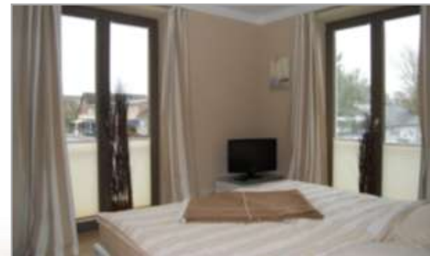
Schlafzimmer mit LCD-TV und großem Schrank

Tanja und Alexander Feldt Steingarten 48 42699 Solingen