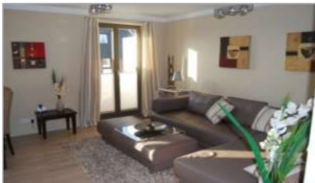
Wohnzim. m. elektrisch vergrößerbarem Ledersofa