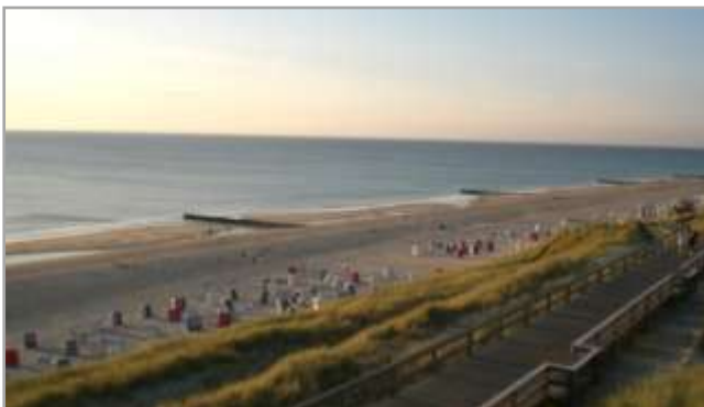
Strand von Wenningstedt