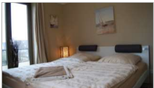
Schlafzimmer mit Doppelbett