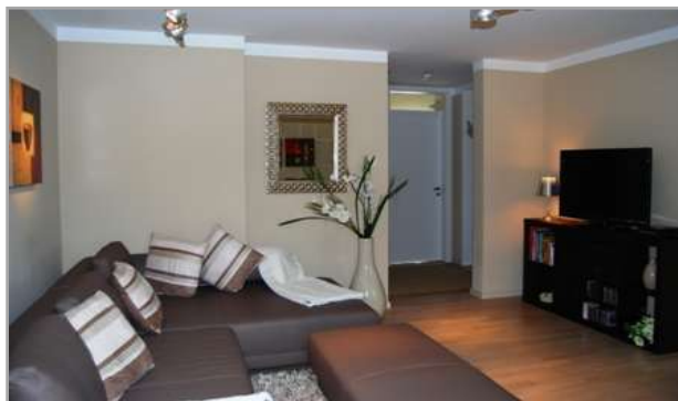
Wohnzimmer mit LCD-TV und kostenlosem Internet