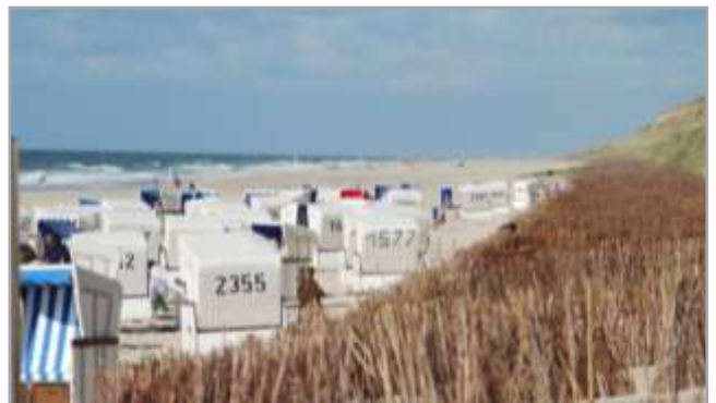
Hundestrand von Wenningstedt