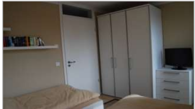
Zweites Schlafzimmer mit Schrank und LCD-TV