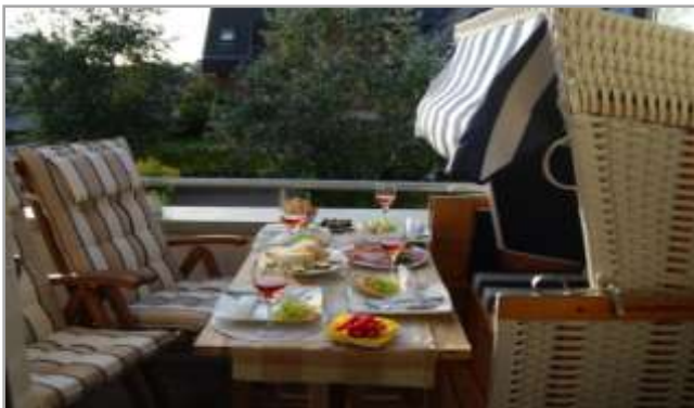
Süd-West Balkon mit Blick zum Dorfteich