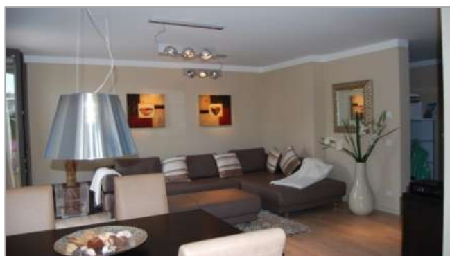
Wohnzimmer mit Essbereich und Schreibtisch