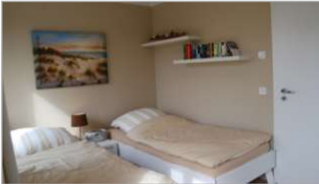
Zweites Schlafzimmer mit zwei Einzelbetten