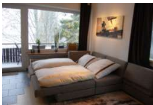
Ausklappbares Doppelbett im Wohnzimmer