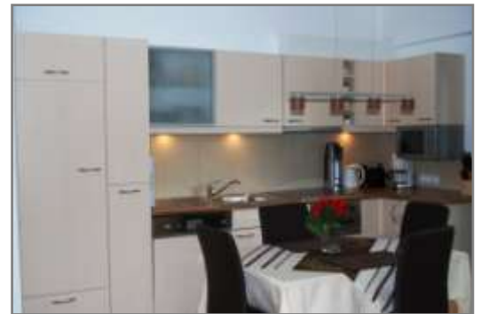
vollausgestattete offene Küche mit Essbereich