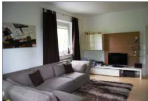
Wohnzimmer mit Couch und Flachbildschirmfernseher