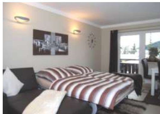
Le canapé en cuir au salon peut être rallongé sur un canapé-lit à 2 personnes.