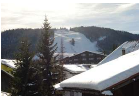
Vue du balcon à Gschwandtkopf