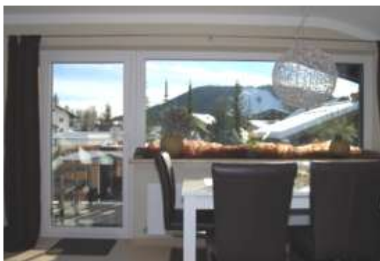
Vue du salon