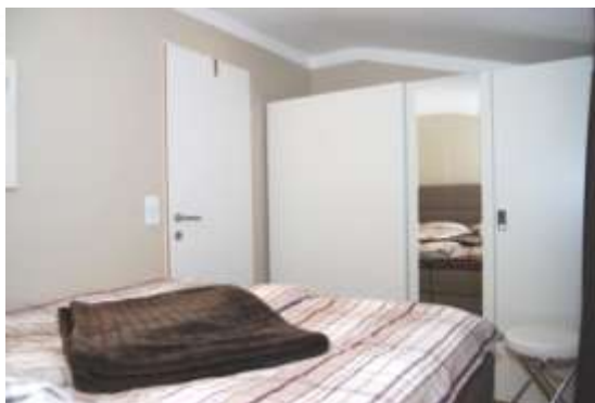
Chambre à coucher avec armoire