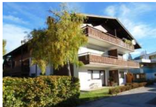
L'app. se trouve an 2eme étage à gauche