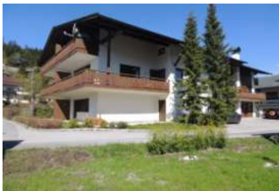
La maison de la page