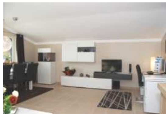
Salon avec cheminée et télé.