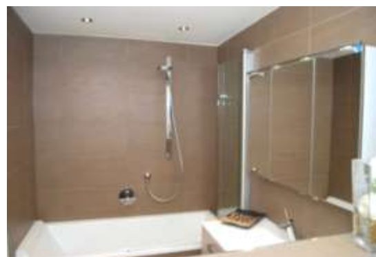
Baignoire avec douche