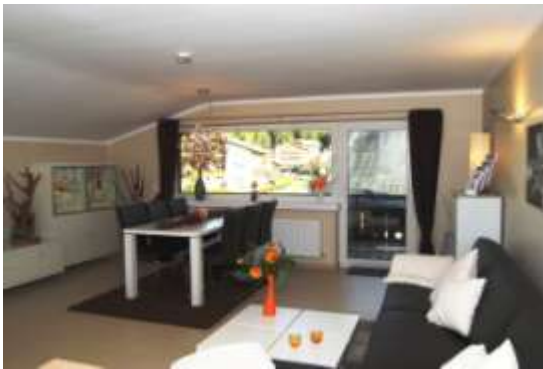
Wohnzimmer mit großzügigem Esstisch