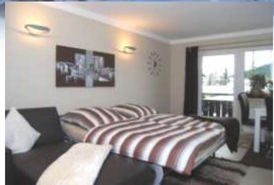
Ausgeklapptes Doppelbett in der Wohnzimmerledergarnitur