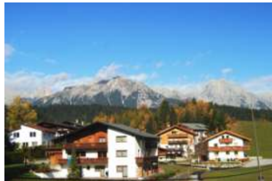
Ausblick vom Balkon bis auf das Zugspitzplateau