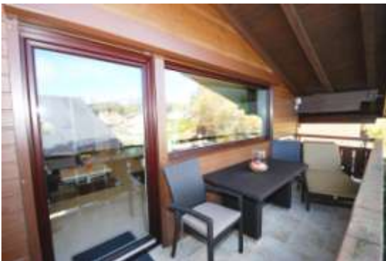
Süd-West-Balkon mit Loggia mit Liegestuhl, Tisch, 4 Stühlen