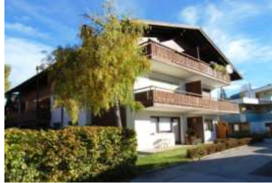
Das App. befindet sich in der 2. Etage auf der linken Seite