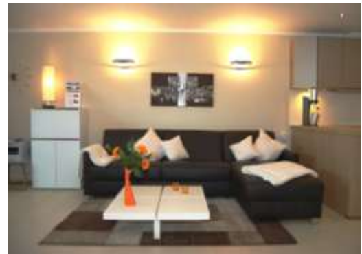
Ledergarnitur mit integriertem 1,80 m breitem Doppelbett