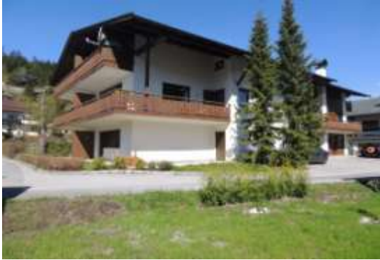
Das Haus von der Seite