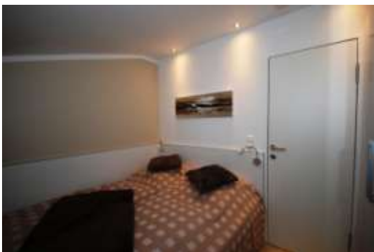
Einbaubetten aufklappbar für Stauraum