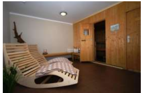
Finnische Sauna (mit Münzeinwurf) zur Eigennutzung mit Kälteraum und Duschanlagen.

Unsere Appartements bieten nun auch die Möglichkeit zu Skypen – kostenlos weltweit Videotelefonieren m. Familie, Freunden o. Geschäftspartnern.