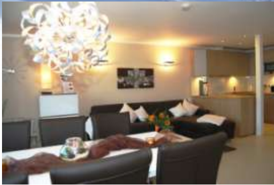
Großzügiger Esstisch mit 6 Stühlen (Tisch ausziehbar zu 2,20 m)